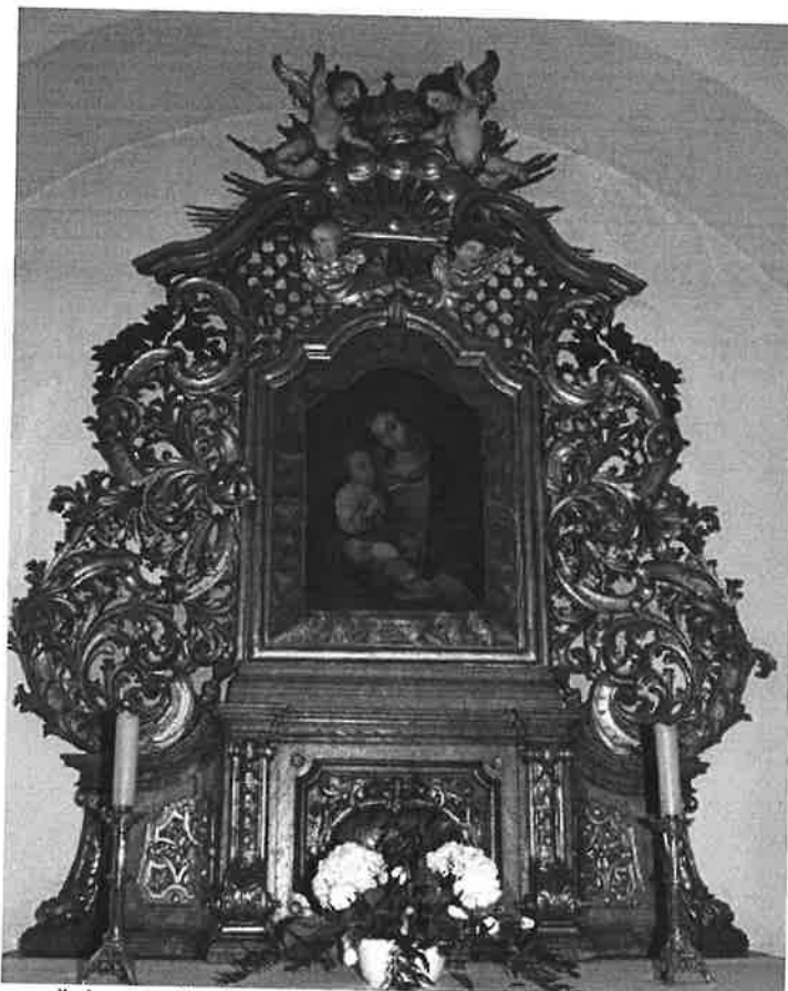
il. 1. Nastawa ołtarza Matki Boskiej, pocz. XX wieku stan przed konserwacją