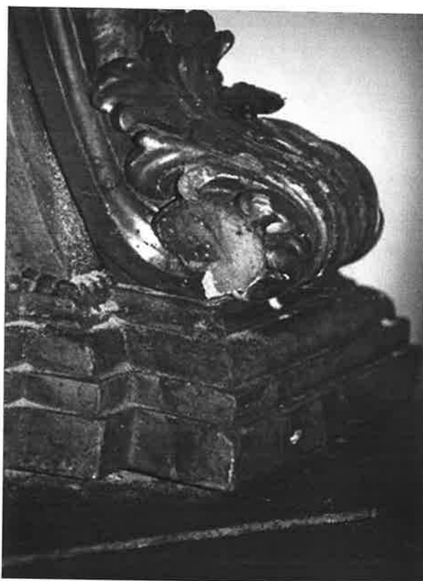
il. 6. Detal podstawy nastawy ołtarzowej stan przed konserwacją