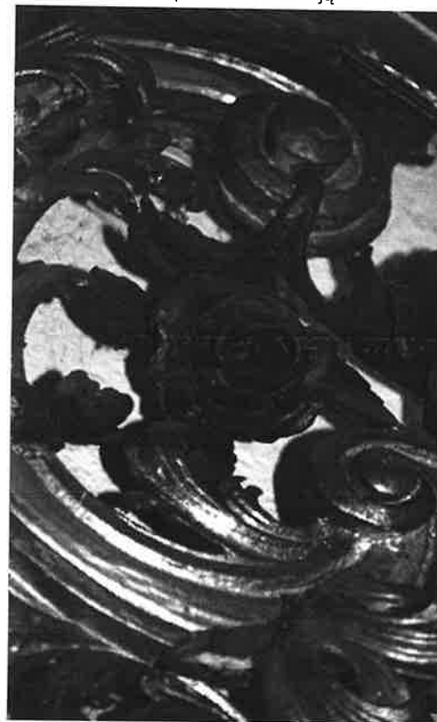
il. 4. Detal uszaka stan przed konserwacją