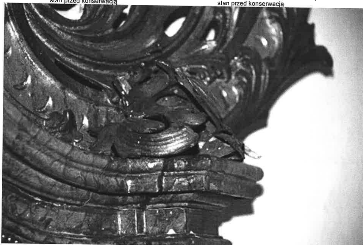
il. 7. Odspojone detale uszaka stan przed konserwacją