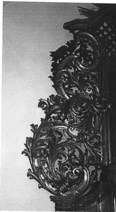
il. 2. Lewy uszak, pocz. XX w. stan przed konserwacją