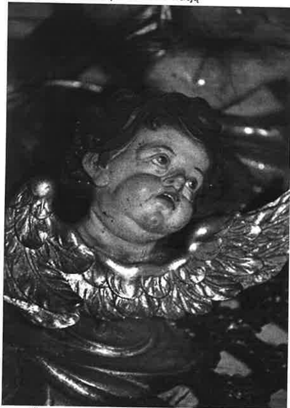
il. 3. Uskrzydłona główka aniołka stan przed konserwacją